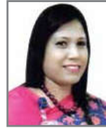
শুলশান আরা পরিচালক প্রবানমন্ত্রীর কার্যালয়