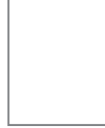
প্রতিনিধি মহিলা ও শিশু বিষয়ক মন্ত্রণালয়