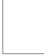
প্রতিনিধি আর্থিক প্রতিষ্ঠান বিভাগ