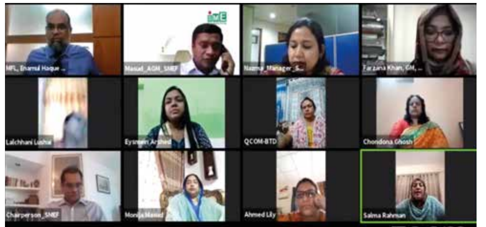
করোনার দ্বিতীয় ঢেউ মোকাবেলার প্রস্তুতি নিয়ে নারী-উদ্যোক্তাদের সাথে মতবিনিময় সভায় অংশগ্রহণকারীদের একাংশ