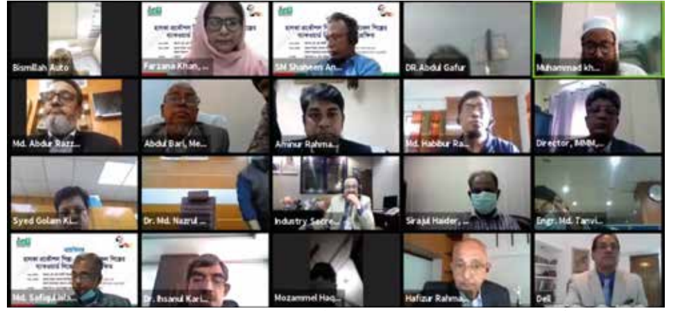
‘হালকা প্রকৌশল শিল্প: মোটরসাইকেল শিল্পের ব্যাকওয়ার্ড লিংকেজ উন্নয়ন প্রেক্ষিত’ ওয়েবিনারে অংশগ্রহণকারীদের একাংশ