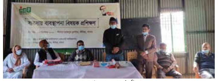
পাবনায় ‘ব্যবসা ব্যবস্থাপনা’ প্রশিক্ষণ

০৬-০৮ অক্টোবর ২০২০ কুষ্টিয়ার কুমারখালী টেক্সটাইল শিল্প ক্লাস্টারে ‘বিপণন কৌশল’ প্রশিক্ষণ অনুষ্ঠিত হয়। এতে ক্লাস্টারে উৎপাদিত পণ্য সফলভাবে বিপণন প্রক্রিয়া, বর্তমান বাজার ব্যবস্থা, অনলাইন বিপণন মাধ্যম, করোনাকালীন সময়ে বিকল্প পণ্য এবং বিপণন ইত্যাদি সম্পর্কে উদ্যোক্তাদের ধারণা দেয়া হয়। উক্ত প্রশিক্ষণে কুমারখালী টেক্সটাইল শিল্প ক্লাস্টারের ২০জন উদ্যোক্তা অংশগ্রহণ করেন।