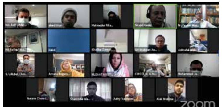
এসএমই সংশ্লিষ্ট ট্রেডবন্ডির কর্মকর্তাদের জন্য 'আইসিটি ব্যবহারে দক্ষতা উন্নয়ন' কর্মশালায় অংশগ্রহণকারীদের একাংশ

এসএমই খাতের সার্বিক উন্নয়নের জন্য অ্যাসোসিয়েশন, ট্রেডবন্ডি ও চেম্বারের সক্ষমতা বৃদ্ধি অন্যতম প্রধান পূর্বশর্ত হিসেবে বিবেচনা করা হয়। এ প্রেক্ষাপটে এসএমই ফাউন্ডেশন এসএমই সংশ্লিষ্ট অ্যাসোসিয়েশন এবং তাদের কর্মকর্তাদের দক্ষতা ও সক্ষমতা বৃদ্ধি কার্যক্রমের অংশ হিসেবে অনলাইন প্ল্যাটফর্মে অক্টোবর-ডিসেম্বর ২০২০ এ 'অফিস ও ব্যবসা ব্যবস্থাপনায় আইসিটি ব্যবহার' ২টি কর্মশালার আয়োজন করে। দিনব্যাপী কর্মশালায় অংশগ্রহণকারীদের উদ্দেশ্যে অ্যাসোসিয়েশনের অফিস ব্যবস্থাপনায় আইসিটি টুলস ব্যবহার, উদ্যোক্তাদের ব্যবসা অনলাইনে অন্তর্ভুক্তকরণের প্রক্রিয়া সম্পর্কে বিস্তারিত আলোচনা করা হয়। অনলাইন প্ল্যাটফর্মে অনুষ্ঠিত কর্মশালায় ঢাকা, চট্টগ্রাম, রাজশাহী, খুলনা, সিলেট ও রংপুর বিভাগের ৪২টি চেম্বার অব কমার্স এবং অ্যাসোসিয়েশন এর ৬০জন কর্মকর্তা অংশগ্রহণ করেন। উক্ত কর্মশালা উদ্যোক্তাদের ব্যবসা উন্নয়নে গুরুত্বপূর্ণ ভূমিকা পালন করবে বলে আশা করা যায়।