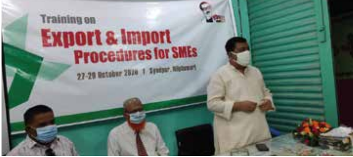
সৈয়দপুর ক্ষুদ্র গার্মেন্টস ক্লাস্টারে ‘রপ্তানি-আমদানি পদ্ধতি’ প্রশিক্ষণ

প্রশিক্ষণে উদ্যোক্তাদের ব্যবসা ব্যবস্থাপনার প্রাথমিক ধারণা থেকে শুরু করে সঠিক উৎপাদন পদ্ধতি অনুসরণ, পণ্য বাজারজাতকরণে সঠিক পছন্দ অবলম্বন, পণ্য বহুমুখীকরণে উৎসাহিতকরণ, সঠিক পদ্ধতিতে ব্যবসায়ের হিসাবরক্ষণ ইত্যাদি বিষয়ে ধারণা দেয়া হয়। এছাড়া করোনাকালীন সময়ে ব্যবসা ব্যবস্থাপনায় বিকল্প পছন্দ অবলম্বনেও উদ্যোক্তাদের উৎসাহিত করা হয়। ৩টি প্রশিক্ষণে ৬০জন উদ্যোক্তা অংশগ্রহণ করেন।