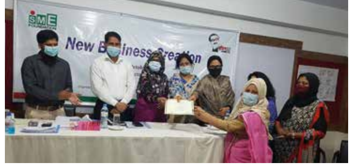
নারী-উদ্যোক্তাদের জন্য 'নতুন ব্যবসা সৃষ্টি' প্রশিক্ষণের সনদ বিতরণ

নারী-উদ্যোক্তাদের জন্য অক্টোবর-ডিসেম্বর ২০২০ এ 'New Business Creation' বিষয়ে ৩টি প্রশিক্ষণ আয়োজন করেছে এসএমই ফাউন্ডেশন। ১৪-১৮ অক্টোবর ময়মনসিংহে, ১৮-২২ অক্টোবর সিরাজগঞ্জে এবং ০৮-১২ নভেম্বর পটুয়াখালীতে এসব প্রশিক্ষণের আয়োজন করা হয়। এসব প্রশিক্ষণে উদ্যোক্তার ব্যক্তিগত বৈশিষ্ট্য মূল্যায়ন, ব্যবসায় নৈতিকতা ও সামাজিক দায়িত্ব, উদ্যোক্তাদের ব্যবসায় বাধাসমূহ দূর করার উপায়, ব্যবসায়িক ধারণা বাছাই ও নির্বাচন (ম্যাক্রো-মাইক্রো স্ক্রিনিং), বাজার জরিপ, চেকলিস্ট, ব্যবসায়িক পরিকল্পনার প্রাথমিক ধারণা, প্রণয়ন এবং পরিকল্পনা উপস্থাপন ইত্যাদি বিষয়ে প্রশিক্ষার্থীদের বিস্তারিত ধারণা প্রদান করা হয়। স্বাস্থ্যবিধি মেনে প্রশিক্ষণসমূহে ১০০জন নারী-উদ্যোক্তা অংশগ্রহণ করেন। ২০২০-২১ অর্থবছরে এসএমই ফাউন্ডেশনের নারী-উদ্যোক্তা উন্নয়ন উইং-এর Workshop/Seminar/Training for creation of new women entrepreneurs কর্মসূচির আওতায় ১০টি প্রশিক্ষণ আয়োজনের পরিকল্পনা রয়েছে।