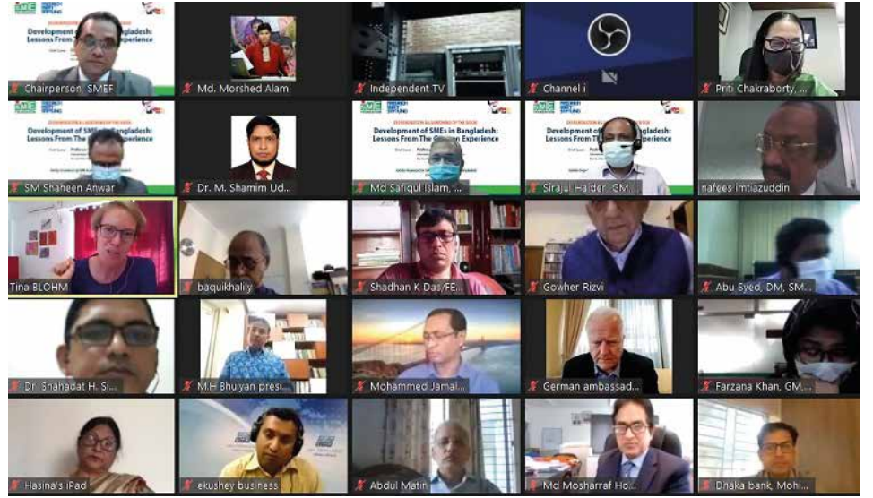
অনলাইনে আয়োজিত অনুষ্ঠানের প্রধান অতিথি মাননীয় প্রধানমন্ত্রীর আন্তর্জাতিক সম্পর্ক বিষয়ক উপদেষ্টা ড. গওহর রিজভী এবং অংশগ্রহণকারীদের একাংশ

গবেষণা প্রতিবেদনে বলা হয়, বাংলাদেশের মোট ব্যবসা প্রতিষ্ঠানের ৯৮ ভাগের বেশি এসএমই। ৮৪ ভাগের বেশি এসএমই প্রতিষ্ঠান গ্রামে অবস্থিত এবং ৮০ ভাগের বেশি কুটির শিল্প। শিল্প খাতের