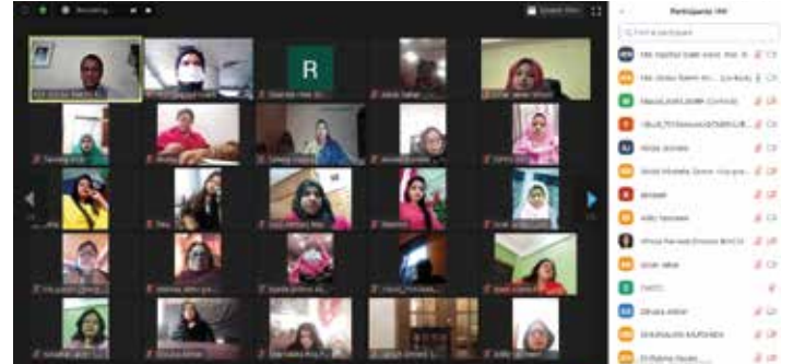
নারী-উদ্যোক্তাদের জন্য 'Negotiation skill development' কর্মশালায় অংশগ্রহণকারীদের একাংশ