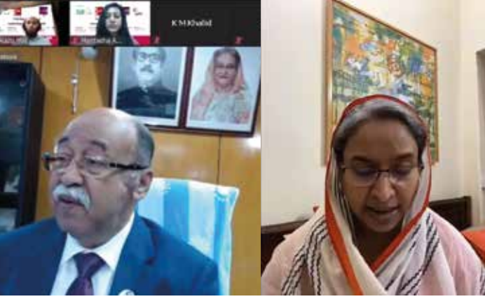
হেরিটেজ হ্যান্ডলুম ফেস্টিভ্যাল ২০২০-এর উদ্বোধনী ও সমাপনী অনুষ্ঠানে শিক্ষামন্ত্রী ও শিল্পমন্ত্রী