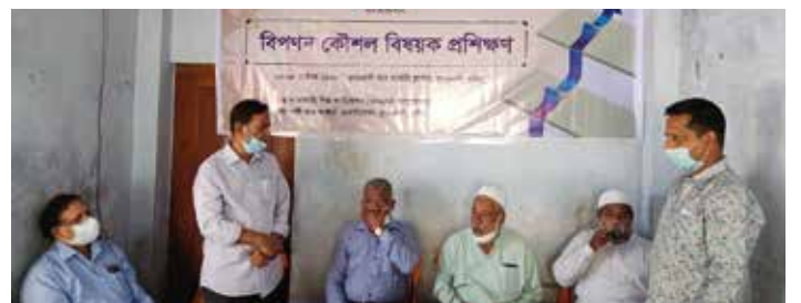
কুষ্টিয়ার কুমারখালী টেক্সটাইল শিল্প ক্লাস্টারে ‘বিপণন কৌশল’ প্রশিক্ষণ

২৮-৩০ অক্টোবর ২০২০ বগুড়া লাইট ইঞ্জিনিয়ারিং ক্লাস্টারের উদ্যোক্তাদের জন্য লাইট ইঞ্জিনিয়ারিং পণ্যের হিট এবং সার্ফেস ট্রিটমেন্ট বিষয়ে ব্যবহারিক প্রশিক্ষণের আয়োজন করে এসএমই ফাউন্ডেশন। বগুড়া বিটাক-এর অবকাঠামোগত সুবিধাদি ব্যবহার করে উদ্যোক্তাদের উৎপাদিত পণ্যের Heat Treatment এর ব্যবহারিক দিকগুলো তুলে ধরেন প্রশিক্ষণগণ। পাশাপাশি তারা করোনাকালীন সময়ে ব্যবসার নানাবিধ দিক তুলে ধরেন এবং উৎপাদিত পণ্যের বহুমুখীকরণ এবং মানোন্নয়নের বিষয়ে আলোকপাত করেন। প্রশিক্ষণে ২০জন উদ্যোক্তা অংশগ্রহণ করেন।