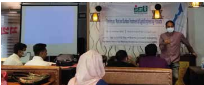
বগুড়া লাইট ইঞ্জিনিয়ারিং ক্লাস্টারে ‘পণ্যের হিট এবং সার্ফেস ট্রিটমেন্ট’ ব্যবহারিক প্রশিক্ষণ

১৮-২৪ ডিসেম্বর ২০২০ জামালপুর নকশীকাঁথা ক্লাস্টারের ৫জন উদ্যোক্তাকে ‘Practical Accounts Maintaining’ বিষয়ে প্রশিক্ষণ প্রদান করা হয়েছে। এসএমই ফাউন্ডেশনের উদ্যোগে আয়োজিত প্রশিক্ষণে প্রশিক্ষক উদ্যোক্তাদের ব্যবসা প্রতিষ্ঠান পরিদর্শন ও তথ্য সংগ্রহ করেন। পরবর্তীতে সংগৃহীত তথ্য-উপাত্তের ভিত্তিতে উদ্যোক্তাদের জন্য কাস্টমাইজড হিসাবরক্ষণ পদ্ধতি তৈরি করা হয়। ৭ দিনব্যাপী এই প্রশিক্ষণে উক্ত ক্লাস্টারের উদ্যোক্তাদের ব্যবহৃত হিসাবরক্ষণ পদ্ধতি পরিবর্তন এবং পরিবর্ধন করে সহজ, সাবলীল হিসাবরক্ষণ পদ্ধতি ডিজাইন করা হয় এবং ডিজাইনকৃত এই নতুন হিসাবরক্ষণ পদ্ধতির ব্যবহারযোগ্যতা পর্যবেক্ষণ করে উদ্যোক্তাদের মতামতের ভিত্তিতে প্রয়োজনীয় পরিবর্তন করা হয়।