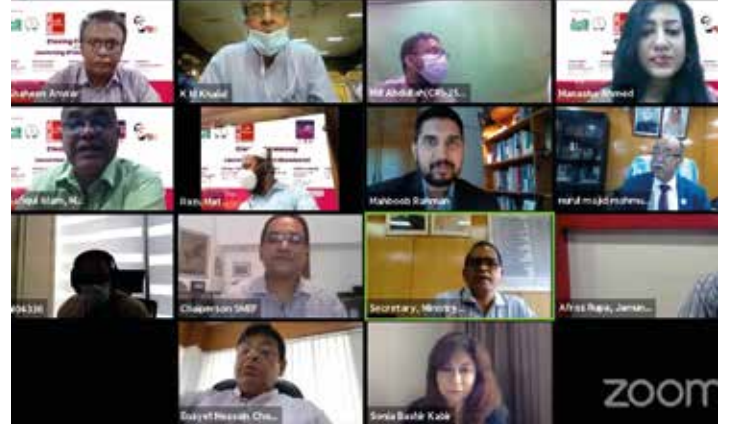
হেরিটেজ হ্যান্ডলুম ফেস্টিভ্যাল ২০২০-এ অতিথিবৃন্দের একাংশ

বাংলাদেশের গৌরবময় ঐতিহ্য ও কৃষ্টির অংশ ঐতিহ্যবাহী তাঁতপণ্যের প্রস্তুতকারক ও শীর্ষস্থানীয় ডিজাইনারদের মধ্যে সংযোগ স্থাপন, বিলুপ্তি রোধকরণ এবং সর্বোপরি দেশে কর্মসংস্থান সৃষ্টির লক্ষ্যে এসএমই ফাউন্ডেশন এবং অ্যাসোসিয়েশন অব ফ্যাশন ডিজাইনার্স বাংলাদেশ (এএফডিবি) টানা তৃতীয়বারের মত আয়োজন করেছে হেরিটেজ হ্যান্ডলুম ফেস্টিভ্যাল। এবারের মেলার শ্লোগান 'আমার পণ্য আমার দেশ, ডিজিটাল বাংলাদেশ'। কোভিড-১৯ পরিস্থিতি বিবেচনায় এবার হেরিটেজ হ্যান্ডলুম ফেস্টিভ্যাল আয়োজন করা হয় অনলাইনে। মেলার অনলাইন পেজ-এ বয়নশিল্প প্রদর্শন, লাইভ ফ্যাশন শো'র পাশাপাশি ৭০টিরও বেশি অনলাইন স্টলে ক্রেতা-দর্শনার্থীদের জন্য প্রদর্শন করা হয় শাড়ী-লুঙ্গি-গামছা, খাদি, নকশীকাঁথা, বেনারসি শাড়ী, টাঙ্গাইল শাড়ী, জামদানি শাড়ী, মনিপুরী কাপড়, রাঙ্গামাটির চাকমাসহ অন্যান্য ক্ষুদ্র নৃগোষ্ঠীর কাপড় ও হস্তশিল্প পণ্য। যেমন: পাটজাত পণ্য বাঁশ ও বেতজাত পণ্য। এছাড়া খাতভিত্তিক পণ্যের ইতিহাস নিয়ে ছিল তথ্যচিত্র, পণ্য সম্পর্কে ক্রেতাদের ধারণা প্রদান, অনলাইন সেমিনারসহ নানা আয়োজন। ফেস্টিভ্যালে অংশগ্রহণ করেন বিভিন্ন অ্যাসোসিয়েশন, ডিজাইনার, শিল্পী, তাঁতীসহ ঐতিহ্যবাহী পণ্যের উদ্যোক্তাগণ। ফেস্টিভ্যালে লোকজ শিল্পীদের সঙ্গীত পরিবেশনা, ফ্যাশন শো, দেশী পোশাক বিষয়ে কুইজ ও ফটো কনটেস্ট, সেমিনার, ক্রেতা-বিক্রেতা ম্যাচমেকিং ইভেন্টের আয়োজন করা হয়।