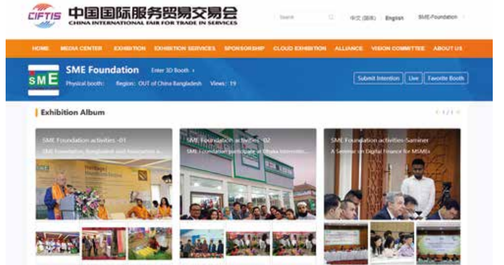
‘China International Fair for Trade in Service (CIFTIS)’ এর ওয়েব পোর্টাল

স্বত্বাধিকারী: হাসিনা মুক্তা হ্যান্ডিক্রাফটস এর প্রতিষ্ঠান