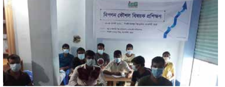
বগুড়ায় 'বিপণন কৌশল' প্রশিক্ষণ

বগুড়ার শাঁওইল হ্যান্ডলুম শিল্প ক্লাস্টারে উদ্যোক্তাদের জন্য 'বিপণন কৌশল' বিষয়ে প্রশিক্ষণ অনুষ্ঠিত হয় ২৫-২৭ আগস্ট ২০২০। প্রশিক্ষণে পণ্য বিপণন প্রক্রিয়া, বর্তমান বাজার ব্যবস্থা, অনলাইন বিপণন মাধ্যমসহ বিভিন্ন বিষয়ে উদ্যোক্তাদের ধারণা প্রদান করা হয়। প্রশিক্ষণটিতে বগুড়ার শাঁওইল হ্যান্ডলুম শিল্প ক্লাস্টারের ২০জন উদ্যোক্তা অংশগ্রহণ করেন। এই ক্লাস্টারে প্রায় ৬,০০০-৭,০০০ তাঁতী, ১,৫০০ উদ্যোক্তা। প্রায় ৬০,০০০ লোক প্রত্যক্ষ ও পরোক্ষভাবে কর্মরত। শাঁওইল বাজার হ্যান্ডলুম শিল্প ক্লাস্টারের প্রধান পণ্য সূতা, কম্বল, চাদর, শাল চাদর, গামছা, তোয়ালে, বিছানার চাদর, পাপশ।