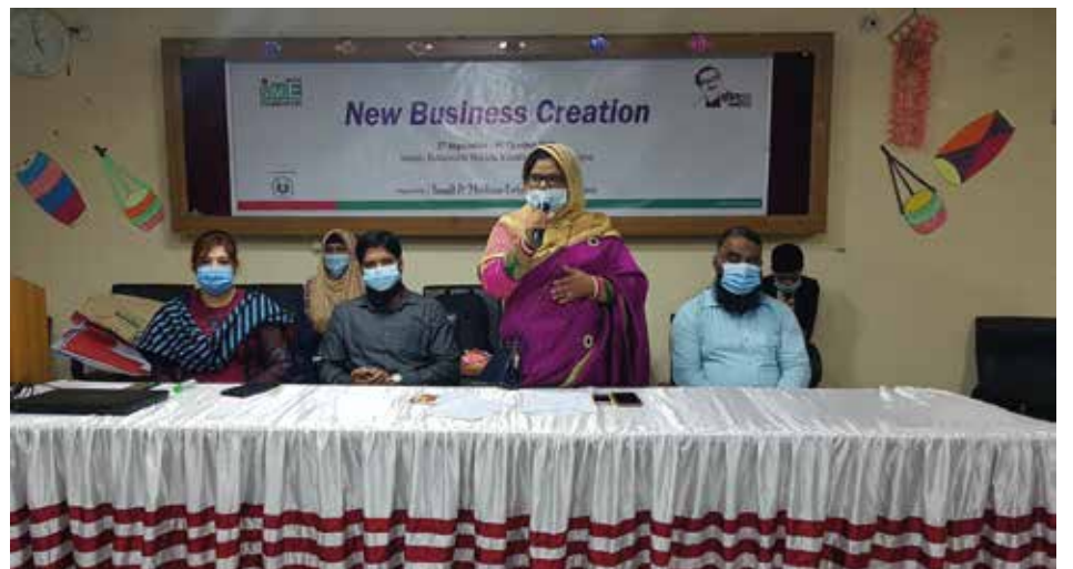
'নারী-উদ্যোক্তাদের জন্য 'নতুন ব্যবসা সৃষ্টি' প্রশিক্ষণে অতিথিবৃন্দ

একই বিষয়ে ২য় প্রশিক্ষণটি সরাসরি দিনাজপুরে আয়োজন করা হয়। স্বাস্থ্যবিধি মেনে আয়োজিত প্রশিক্ষণটিতে ৩১জন নতুন নারী-উদ্যোক্তা অংশগ্রহণ করেন। সফলভাবে প্রশিক্ষণ সম্পন্ন করার জন্য নারী-উদ্যোক্তাদের সনদপত্র প্রদান করা হয়। ২০২০-২১ অর্থবছরে