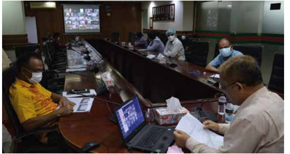
শিল্প মন্ত্রণালয়ের সাথে ২০২০-২১ অর্থবছরের বার্ষিক কর্মসম্পাদন চুক্তি (এপিএ) সই করেছে এসএমই ফাউন্ডেশন