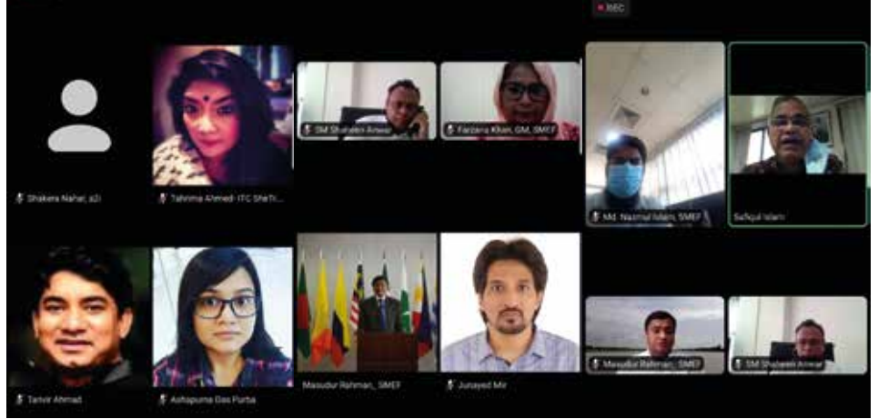
নারী-উদ্যোক্তা উন্নয়নে আন্তর্জাতিক সহযোগী সংস্থাসমূহের সাথে যৌথ কর্মপরিকল্পনা নির্ধারণ বিষয়ক সভায় উপস্থিতির একাংশ