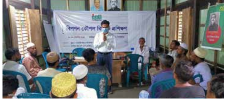
পিরোজপুরের বলদিয়া ক্রিকেট ব্যাট ক্লাস্টারে 'বিপণন কৌশল' প্রশিক্ষণ

বলদিয়া ক্রিকেট ব্যাট ক্লাস্টারে উদ্যোক্তাদের জন্য 'বিপণন কৌশল' বিষয়ে প্রশিক্ষণের আয়োজন করা হয় ২৮-৩০ সেপ্টেম্বর ২০২০। উদ্যোক্তারা কীভাবে তাদের উৎপাদিত পণ্য সফলভাবে বিপণন করতে পারেন, পাশাপাশি ক্রিকেট ব্যাটের বর্তমান বাজার ব্যবস্থা, অনলাইন বিপণন মাধ্যম ইত্যাদি সম্পর্কে আলোচনা করা হয় প্রশিক্ষণে। এতে বলদিয়া ক্রিকেট ব্যাট ক্লাস্টারের ২০জন উদ্যোক্তা অংশগ্রহণ করেন। পিরোজপুরের নেছারাবাদ উপজেলার বলদিয়া ক্রিকেট ব্যাট ক্লাস্টারের ২৫০-৩০০ কারখানায় কাজ করেন ৩৫০০-৫০০০ শ্রমিক। ক্লাস্টারটিতে প্রস্তুতকৃত ক্রিকেট ব্যাট ঢাকার সদরঘাটের পাইকারি বাজার হয়ে সারা দেশে ছড়িয়ে পড়ে।