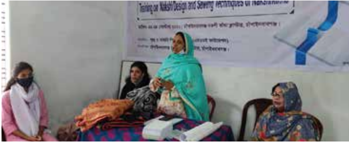
চাঁপাইনবাবগঞ্জে 'নকশী ডিজাইন এবং সেলাই কৌশল' প্রশিক্ষণ