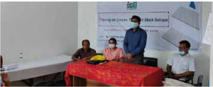
জামালপুরে 'স্ক্রিন প্রিন্ট এবং ব্লক বাটিক কৌশল' প্রশিক্ষণ