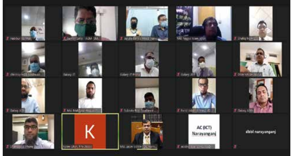
জেলা এসএমই ঋণ মনিটরিং কমিটির সভায় এসএমই ফাউন্ডেশন কর্মকর্তাদের অংশগ্রহণ