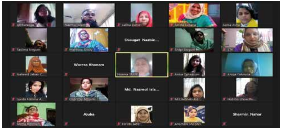
নারী-উদ্যোক্তাদের জন্য 'Online Business Communication & Skill Development' প্রশিক্ষণে অংশগ্রহণকারীদের একাংশ

কোভিড-১৯ প্রেক্ষাপটে নারী-উদ্যোক্তাদের ব্যবসায়িক যোগাযোগের দক্ষতা উন্নয়নের অংশ হিসেবে পণ্য বাজারজাতকরণ কৌশল, নতুন ব্যবসায়িক এটিকেটস, ব্যবসা পরিকল্পনা, প্রোডাক্ট প্রমোশনের জন্য প্রয়োজনীয় ব্যবস্থা গ্রহণ ইত্যাদি বিষয় নারী-উদ্যোক্তাদের কাছে তুলে ধরেন প্রশিক্ষকগণ। মহামারীর সময়েও উৎপাদিত পণ্য বিপণনের ক্ষেত্রে করণীয় ও বর্জনীয়সহ আধুনিক প্রযুক্তির লাগসই ব্যবহার নিশ্চিতকরণের মাধ্যমে ব্যবসায় লাভবান হওয়ার বিভিন্ন উপায় নিয়ে প্রয়োজনীয় দিক নির্দেশনা