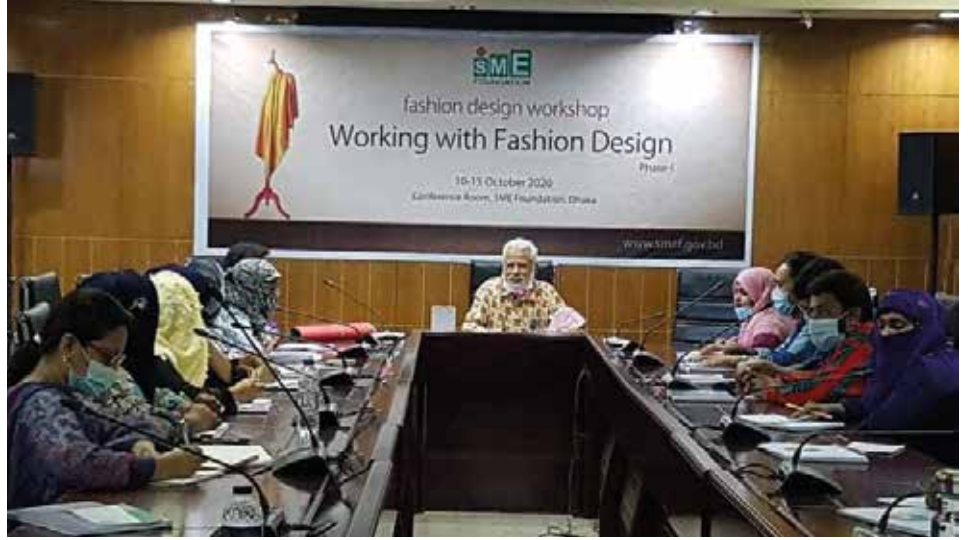
‘নারী-উদ্যোক্তাদের জন্য ‘নতুন ব্যবসা সৃষ্টি’ প্রশিক্ষণে অতিথিবৃন্দ

এছাড়া ২০-২২ জুলাই ২০২০ 'আয়ুর্বেদিক বিউটি থেরাপি' বিষয়ক একটি প্রশিক্ষণ অনলাইন প্ল্যাটফর্মে আয়োজন করা হয়েছে। আয়ুর্বেদিক পণ্য ব্যবহারে নারীদের আগ্রহ দিন দিন বৃদ্ধি পাচ্ছে। উদ্যোক্তাগণ কী ধরনের আয়ুর্বেদিক পণ্য দিয়ে সেবা গ্রহণকারীদের স্বাস্থ্যসম্মত উপায়ে সেবা প্রদান করবেন, প্রশিক্ষণে সে বিষয়ে উদ্যোক্তাদের কাছে বিস্তারিত তুলে ধরেন