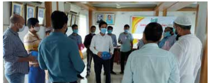
নরসিংদীতে 'বিপণন কৌশল' প্রশিক্ষণ

নরসিংদী টেক্সটাইল ক্লাস্টারের উদ্যোক্তাদের জন্য 'বিপণন কৌশল' বিষয়ে প্রশিক্ষণ অনুষ্ঠিত হয় ১৫-১৭ সেপ্টেম্বর ২০২০। উদ্যোক্তারা কীভাবে তাদের উৎপাদিত পণ্য সফলভাবে বিপণন করতে পারেন, পাশাপাশি টেক্সটাইল পণ্যের বর্তমান বাজার ব্যবস্থা, অনলাইন বিপণন মাধ্যমসহ বিভিন্ন বিষয়ে প্রশিক্ষণে উদ্যোক্তাদের জন্য আলোচনা করা হয়। এতে নরসিংদী টেক্সটাইল ক্লাস্টারের ২০জন উদ্যোক্তা অংশগ্রহণ করেন। ক্লাস্টারটিতে প্রায় ৮০টি কারখানায় প্রায় ৩০০০জন কর্মী রয়েছে।