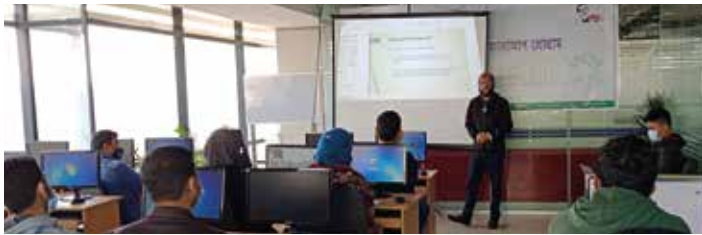
‘ক্ষুদ্র ও মাঝারি শিল্প উদ্যোক্তাদের ই-কমার্স’ ফলোআপ প্রোগ্রামে অংশগ্রহণকারীদের একাংশ

ক্ষুদ্র ও মাঝারি শিল্পের উদ্যোক্তাদের অনলাইন ব্যবসা/ই-কমার্সে সক্ষমতা অর্জনে এসএমই ফাউন্ডেশন কাজ করে যাচ্ছে। এরই ধারাবাহিকতায় ফাউন্ডেশন ঢাকাসহ বিভাগীয় পর্যায়ে এসএমই উদ্যোক্তাদের জন্য ‘ই-কমার্স ও ই-মার্কেটিং’ প্রশিক্ষণ কর্মসূচি বাস্তবায়ন করে আসছে। প্রশিক্ষণ পরবর্তী উদ্যোক্তাদের বর্তমান অবস্থা পর্যালোচনা ও বর্তমান সময়ের প্রয়োজনীয় ও গুরুত্বপূর্ণ অনলাইন ব্যবসায়িক কৌশলসমূহের সাথে পরিচয় করে দেয়ার লক্ষ্যে ঢাকায় ০৭-০৮ ফেব্রুয়ারি ২০২২ ‘ই-কমার্স ফলোআপ’ প্রোগ্রামের আয়োজন করা হয়। অনুষ্ঠানে ২০জন উদ্যোক্তা অংশগ্রহণ করেন।