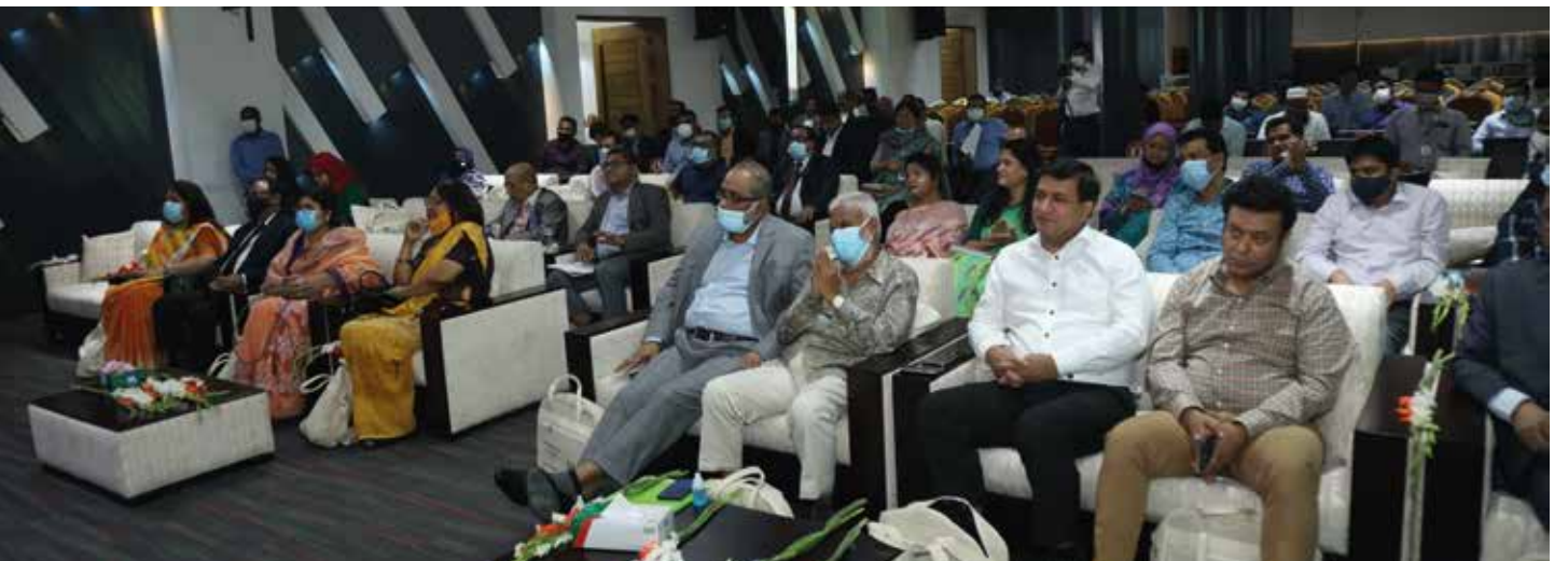
এসএমই ফাউন্ডেশনের ১৬তম বার্ষিক সাধারণ সভায় সাধারণ পর্যদ সদস্য ও অন্যান্য অতিথিবৃন্দ