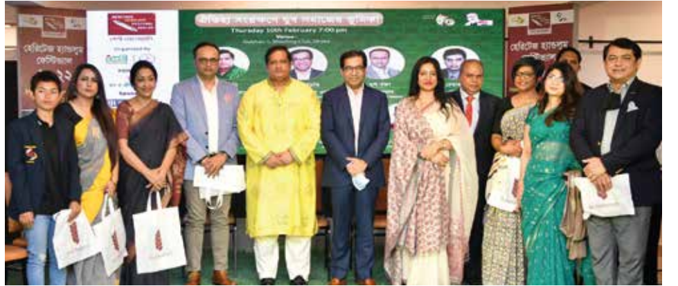
‘ঐতিহ্য সংরক্ষণে যুব সমাজের ভূমিকা’ সেমিনারে প্রধান অতিথি যুব ও ক্রীড়া প্রতিমন্ত্রী জাহিদ আহসান রাসেল এমপি ও অন্যান্য অতিথিবৃন্দ