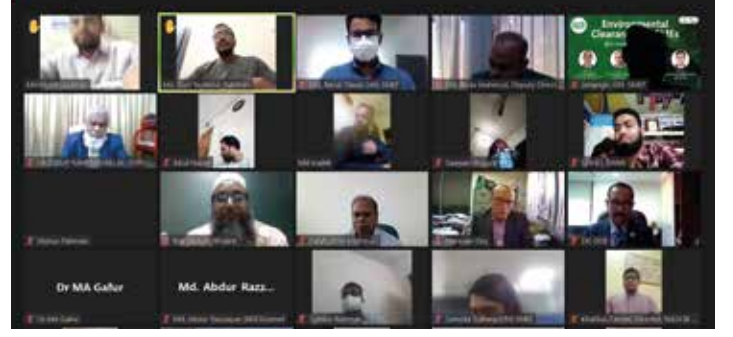
‘ক্ষুদ্র ও মাঝারি শিল্পের পরিবেশগত ছাড়পত্র’ ওয়েবিনারে অংশগ্রহণকারীদের একাংশ