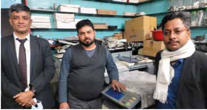
প্রণোদনা প্যাকেজের আওতায় ঋণপ্রাপ্ত উদ্যোক্তাদের মনিটরিং কর্মসূচিতে উদ্যোক্তাদের সাথে ফাউন্ডেশনের প্রতিনিধি