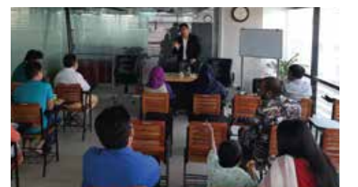
ইনকিউবেটিদের সাথে জাতীয় এসএমই উদ্যোক্তা পুরস্কারপ্রাপ্ত উদ্যোক্তার সাথে মতবিনিময়