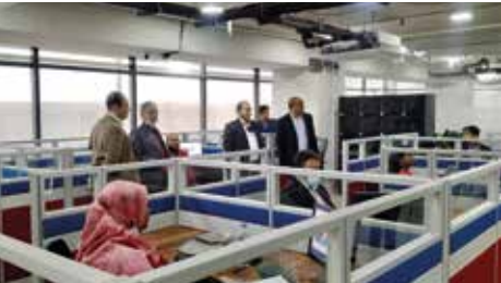
বিজনেস ইনকিউবেশন সেন্টার পরিদর্শন করছেন ফাউন্ডেশনের ব্যবস্থাপনা পরিচালক