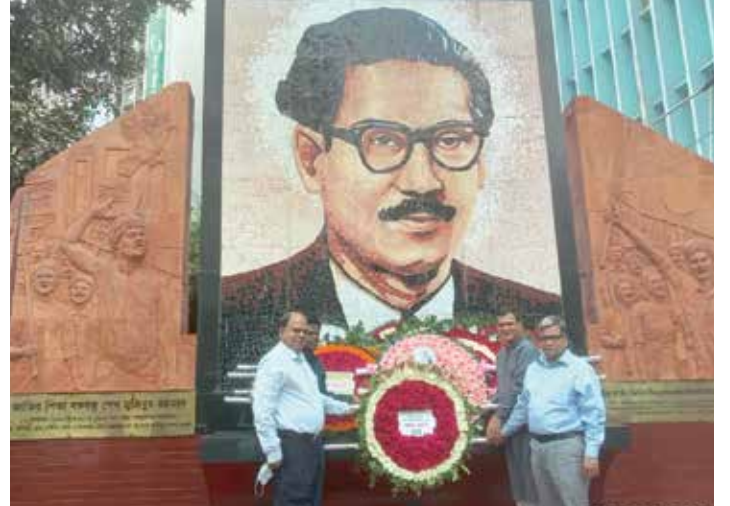
মহান স্বাধীনতা দিবসে ফাউন্ডেশনের পক্ষে শ্রদ্ধা নিবেদন করছেন উপব্যবস্থাপনা পরিচালক