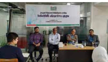
ইনকিউবেটিদের ওরিয়েন্টেশন প্রোগ্রাম