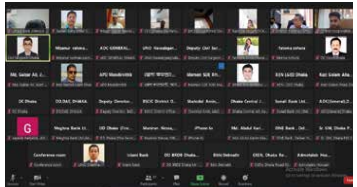
জেলা এসএমই ঋণ মনিটরিং কমিটির সভায় অংশগ্রহণকারীদের একাংশ

কুটির, মাইক্রো, ক্ষুদ্র ও মাঝারি শিল্প উদ্যোক্তাদের (CMSME) সক্ষমতা অক্ষুণ্ণ রাখা এবং শিল্প কারখানায় নিয়োজিত জনবলকে কাজে বহাল রাখার উদ্দেশ্যে ব্যাংকিং ব্যবস্থার মাধ্যমে স্বল্প সুদে চলতি মূলধন ঋণ/বিনিয়োগ সুবিধা প্রবর্তনের জন্য মাননীয় প্রধানমন্ত্রী ২০ হাজার কোটি টাকার প্রণোদনা প্যাকেজ ঘোষণা করেন। বর্তমানে প্রণোদনা প্যাকেজের আওতায় দ্বিতীয় ধাপে আরো ২০ হাজার কোটির ঋণ বিতরণের কার্যক্রম চলমান রয়েছে। প্রণোদনা প্যাকেজের আওতায় এসএমই খাতের ঋণ বিতরণ কার্যক্রম সমন্বিত ও সুচারুরূপে বাস্তবায়নে সহযোগিতার জন্য মন্ত্রিপরিষদ বিভাগের অনুমোদনক্রমে শিল্প মন্ত্রণালয়ের উদ্যোগে জেলা প্রশাসককে আহ্বায়ক করে 'জেলা এসএমই ঋণ বিতরণ মনিটরিং কমিটি' গঠন করা হয়। এসএমই ফাউন্ডেশনের প্রতিনিধিবৃন্দ এই কমিটির সদস্য হিসেবে এখন পর্যন্ত প্রায় তিনশতাধিক অনলাইন সভায় অংশগ্রহণ করে ক্ষতিগ্রস্ত উদ্যোক্তাদের তালিকা প্রণয়ন, লিড ব্যাংকের সক্রিয় দায়িত্ব পালন ও প্রতিটি ব্যাংক শাখায় হেল্প ডেস্ক স্থাপন, স্থানীয়ভাবে প্রচার-প্রচারণা ও উপখাতভিত্তিক বিতরণের বিষয়ে গুরুত্বপূর্ণ মতামত ও পরামর্শ প্রদান করেন। এছাড়া ফাউন্ডেশন প্রণোদনা প্যাকেজ সৃষ্টিভাবে বাস্তবায়ন তথা প্রান্তিক উদ্যোক্তাদের জন্য ঋণ প্রাপ্তি সহজীকরণের উদ্দেশ্যে একটি গাইডলাইন প্রণয়ন করেছে। পাশাপাশি জেলা এসএমই ঋণ মনিটরিং কমিটিকে সার্বিক সহায়তার উদ্দেশ্যে একটি ঋণ মনিটরিং ফরম্যাট