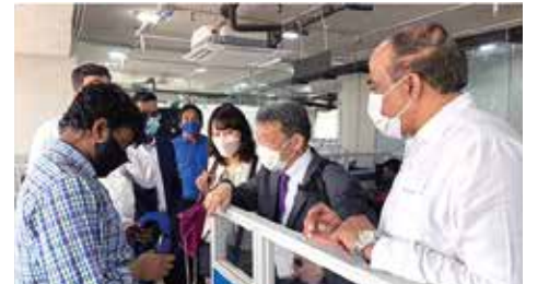
ইনকিউবেটিদের জাইকা প্রতিনিধিদের সাথে মতবিনিময়