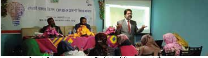
‘এসএমই ব্যবসায় উদ্ভাবন: COVID-19 প্রেক্ষাপট’ কর্মশালায় অতিথিবৃন্দ ও অংশগ্রহণকারীদের একাংশ

ব্যবসায় সফল হওয়ার জন্য পণ্য ও বাজার সম্পর্কে নতুন কিছু উদ্ভাবন করা প্রয়োজন, যা বর্তমান করোনা পরিস্থিতিতে অধিক গুরুত্বপূর্ণ হয়ে উঠেছে। সে লক্ষ্যে ২৩ ফেব্রুয়ারী ২০২২ ‘এসএমই ব্যবসায় উদ্ভাবন: COVID-19 প্রেক্ষাপট’ কর্মশালায় আয়োজন করে এসএমই ফাউন্ডেশন। কর্মশালায় বৈশ্বিক বাজারে বৈশ্বিক প্রতিযোগিতায় সাফল্য অর্জন করতে ও তা ধরে রাখতে নতুনত্ব ও উদ্ভাবনের প্রয়োজনীয়তা সম্পর্কে উদ্যোক্তাদের ধারণা প্রদান করা হয়। কর্মশালায় ৫৫জন এসএমই উদ্যোক্তা অংশগ্রহণ করেন।