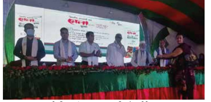
বিভাগীয় এসএমই মেলা খুলনা-এর সমাপনী অনুষ্ঠানে অতিথিবৃন্দ