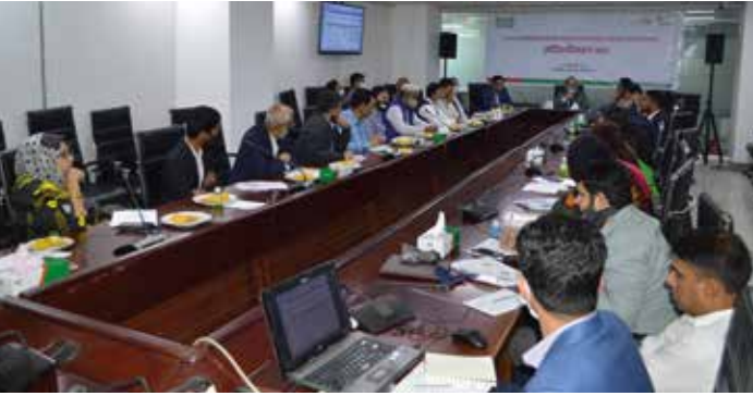
২০২২-২৩ অর্থবছরের বাজেটে বিবেচনার জন্য জাতীয় রাজস্ব বোর্ড (এনবিআর)-এর কাছে প্রস্তাবনা প্রেরণের পূর্বে এসএমই অ্যাসোসিয়েশন ও ট্রেডবডি'র প্রতিনিধিদের সাথে যৌক্তিকীকরণ সভায় অতিথিবৃন্দ