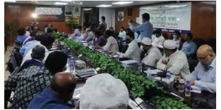
২০২২-২৩ অর্থবছরের বাজেটে বিবেচনার জন্য জাতীয় রাজস্ব বোর্ড (এনবিআর)-এর কাছে প্রস্তাবনা উপস্থাপনা সভায় অতিথিবৃন্দ