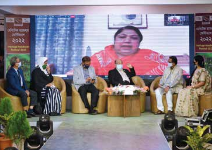
ফেস্টিভ্যালের উদ্বোধনী অনুষ্ঠানে জাতীয় সংসদের মাননীয় স্পিকার ড. শিরীন শারমিন চৌধুরী এমপি, শিল্পমন্ত্রী নূরুল মজিদ মাহমুদ হুমায়ূন এমপি, সংস্কৃতি প্রতিমন্ত্রী কে এম খালিদ এমপি ও অন্যান্য অতিথিবৃন্দ