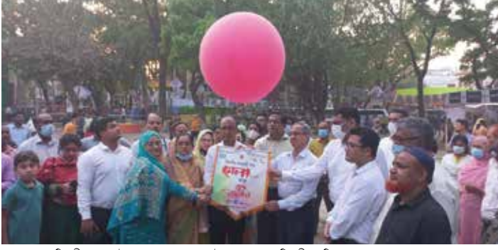
বিভাগীয় এসএমই পণ্য মেলা রংপুর-এর উদ্বোধন করছেন বিভাগীয় কমিশনার, রংপুর