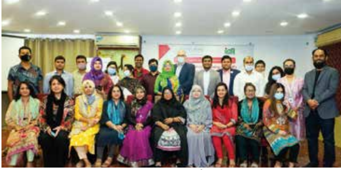
প্রশিক্ষণে আগত অতিথিবৃন্দের সাথে অংশগ্রহণকারী উদ্যোক্তাদের একাংশ