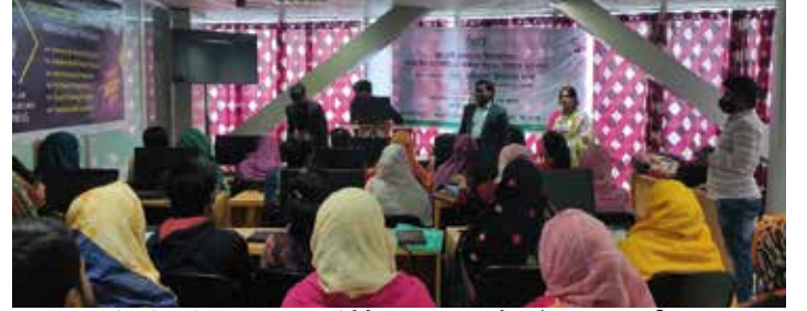
‘এসএমই ক্লাস্টারের উদ্যোক্তাদের ব্যবসায় আইসিটি ব্যবহারে সক্ষমতা বৃদ্ধি’ কর্মশালায় অংশগ্রহণকারীদের একাংশ

এসএমই ফাউন্ডেশন সারা দেশে ১৭৭টি সম্ভাবনাময় ক্ষুদ্র ও মাঝারি শিল্প ক্লাস্টার চিহ্নিত করে এসব ক্লাস্টারের উন্নয়নে কাজ করে যাচ্ছে। এসএমই ক্লাস্টারের উদ্যোক্তাদের ব্যবসায় আইসিটি ব্যবহারে সক্ষমতা বৃদ্ধির লক্ষ্যে ঢাকায় ও যশোরে কর্মশালায় আয়োজন করে ফাউন্ডেশন। ১৯ জানুয়ারি ২০২২ সাতারের ভাকুর্ভা ক্লাস্টারে উদ্যোক্তাদের নিয়ে এবং ১৫-১৬ ফেব্রুয়ারি ২০২২ যশোর নকশীকাঁথা ক্লাস্টারের উদ্যোক্তাদের নিয়ে ২টি কর্মশালা অনুষ্ঠিত হয়। কর্মশালায় ব্যবসা অটোমেশনে সরকারের গৃহীত কার্যক্রম, ব্যবসা বিকাশে ওয়েবসাইটের ব্যবহার, সাইবার নিরাপত্তা সচেতনতা, ব্যবসায় আইসিটি/অনলাইনের ব্যবহার ও অনলাইন মার্কেটিং সম্পর্কে আলোচনা করা হয়। কর্মশালায় ৪০জন উদ্যোক্তা/প্রতিনিধি অংশগ্রহণ করেন।