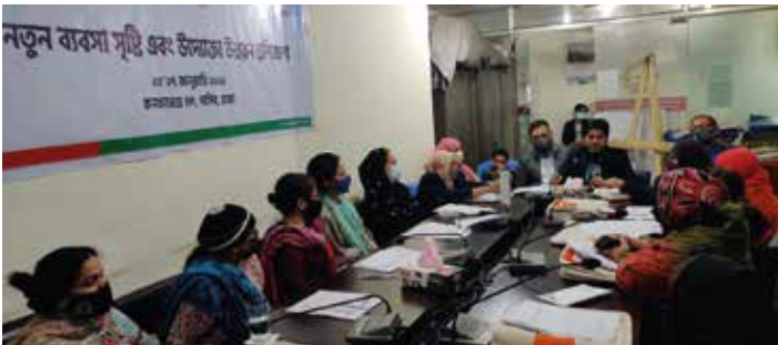
সূনামগঞ্জে ‘New Business Creation for women entrepreneurs’ প্রশিক্ষণে অংশগ্রহণকারী উদ্যোক্তাদের একাংশ

২৩-২৭ নভেম্বর ২০২১ সূনামগঞ্জে ‘New Business Creation for women entrepreneurs’ প্রশিক্ষণের আয়োজন করা হয়। একই বিষয়ে দ্বিতীয় প্রশিক্ষণ ২৩-২৭ জানুয়ারি ২০২২ ঢাকায় আয়োজন করা হয়। প্রশিক্ষণে উদ্যোক্তার ব্যক্তিগত বৈশিষ্ট্য মূল্যায়ন, ব্যবসায় নৈতিকতা ও সামাজিক দায়িত্ব, ব্যবসায় বাধাসমূহ দূর করার উপায়, ব্যবসায়িক ধারণা বাছাই ও নির্বাচন, বাজার জরিপ চেকলিষ্ট, ব্যবসায় পরিকল্পনার প্রাথমিক ধারণা, ব্যবসায় পরিকল্পনা প্রণয়ন এবং ব্যবসায় পরিকল্পনা উপস্থাপন বিষয়ে প্রশিক্ষণার্থীদের বিস্তারিত ধারণা প্রদান করা হয়। এসএমই ফাউন্ডেশনের নারী-উদ্যোক্তা উন্নয়ন উইং’র ২০২১-২২ অর্থবছরের কর্মপরিকল্পনায় ‘New women entrepreneurs Development programs’ কর্মসূচির আওতায় এমন ০৭টি প্রশিক্ষণ আয়োজনের পরিকল্পনা রয়েছে।