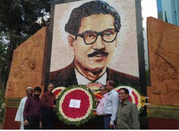
জাতির পিতা বঙ্গবন্ধু শেখ মুজিবুর রহমান এর জন্মবার্ষিকীতে ফাউন্ডেশনে পক্ষে শ্রদ্ধা নিবেদন করছেন ব্যবস্থাপনা পরিচালক