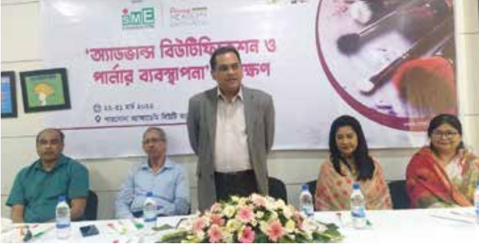
আয়ডাক্স বিউটিফিকেশন ও পার্লার ব্যবস্থাপনা প্রশিক্ষণের সমাপনী অনুষ্ঠানে ফাউন্ডেশনের চেয়ারপার্সন ও অন্যান্য অতিথিবৃন্দ

এসএমই ফাউন্ডেশনের ইনস্টিটিউট অব এসএমই ফাউন্ডেশন দেশের এসএমই খাতের উন্নয়নে ঢাকাসহ বাংলাদেশের বিভিন্ন অঞ্চলের চাহিদা অনুযায়ী বিভিন্ন প্রশিক্ষণ পরিচালনা করে থাকে। উদ্যোক্তা/ট্রেডবডি/অ্যাসোসিয়েশন/চেম্বার/ষ্টেকহোল্ডারদের প্রয়োজনীয় প্রশিক্ষণ প্রদানের মাধ্যমে তাদের জ্ঞান ও দক্ষতা বৃদ্ধি এবং তা ব্যবসা প্রতিষ্ঠান পরিচালনায় যথাযথভাবে কাজে লাগিয়ে প্রতিষ্ঠানের উন্নয়ন ও সার্বিকভাবে এসএমই খাতের বিকাশে ইনস্টিটিউট অব এসএমই ফাউন্ডেশন বিভিন্ন প্রশিক্ষণ কার্যক্রম বাস্তবায়ন করে যাচ্ছে। জানুয়ারি-মার্চ ২০২২ ইনস্টিটিউট অব এসএমই ফাউন্ডেশন উদ্যোক্তাগণের দক্ষতা ও সক্ষমতা বৃদ্ধিতে বিভিন্ন বিষয়ে ৪৪টি প্রশিক্ষণ কর্মসূচি বাস্তবায়ন করেছে। এতে ১২৮৪জন প্রশিক্ষণার্থী অংশগ্রহণ করেন।