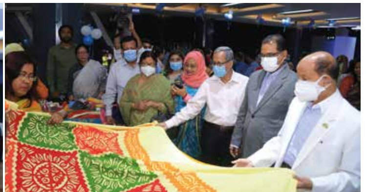
উদ্যোক্তাদের পণ্য পরিদর্শন করছেন শিল্প প্রতিমন্ত্রী কামাল আহমেদ মজুমদার এমপি ও অন্যান্য অতিথিবৃন্দ