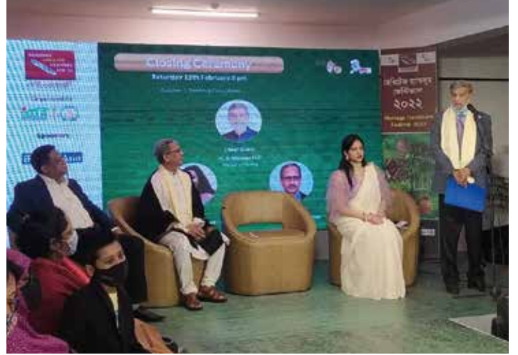
ফেস্টিভ্যালের সমাপনী অনুষ্ঠানে পরিকল্পনামন্ত্রী এম এ মান্নান এমপি ও অন্যান্য অতিথিবৃন্দ