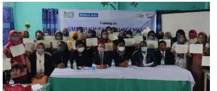
SME Business Management for Women Entrepreneurs প্রশিক্ষণে অংশগ্রহণকারীদের একাংশ বিষয়ে দুইটি প্রশিক্ষণ ২২-২৬ ফেব্রুয়ারি ২০২২ ফরিদপুর ও ময়মনসিংহে আয়োজিত হয়। প্রশিক্ষণসমূহে ৯০জন প্রশিক্ষণার্থী অংশগ্রহণ করেন।

ক্ষুদ্র ও মাঝারি উদ্যোক্তাদের আর্থিক ব্যবস্থাপনায় দক্ষ করে তোলার লক্ষ্যে বিভিন্ন ব্যাংক ও অ-ব্যাংক আর্থিক প্রতিষ্ঠানের সাথে এসএমই ফাউন্ডেশনের সমঝোতা স্মারক স্বাক্ষরিত হয়েছে। এসব সমঝোতা স্মারকের আওতায় এসএমই ফাউন্ডেশন ও ব্যাংক এশিয়া’র যৌথ উদ্যোগে ১৬-২০ জানুয়ারি ২০২২ মেহেরপুরে পাঁচ দিনব্যাপী ‘SME Business Management’ প্রশিক্ষণ আয়োজিত হয়। এতে ব্যবসা পরিকল্পনা, ব্যবসা বাছাই ও লক্ষ্য নির্ধারণ, উৎপাদন প্রক্রিয়া ও উৎপাদন পরিকল্পনার বিভিন্ন মডেল আলোচনা, বাজার ও বিপণন ব্যবস্থা বিষয়ে ধারণা, অর্থ সংশ্লিষ্ট বিষয়ে ধারণা ও পরিকল্পনা, ব্যবসায়িক ধারণা বাছাই ও নির্বাচন (ম্যাক্রো/ মাইক্রো স্ক্রিনিং), বাজার জরিপ সংক্রান্ত চেকলিষ্ট, ব্যবসা পরিকল্পনার প্রাথমিক ধারণা, ব্যবসা পরিকল্পনা প্রণয়ন ও ব্যবসা পরিকল্পনা উপস্থাপন বিষয়ে প্রশিক্ষণার্থীদের বিস্তারিত ধারণা প্রদান করা হয়। ঋণ আবেদন প্রক্রিয়া বিশেষতঃ করোনা প্রণোদনা প্যাকেজ থেকে ঋণপ্রাপ্তি সহজীকরণ নিয়েও প্রশিক্ষণে আলোচনা করা হয়। একই