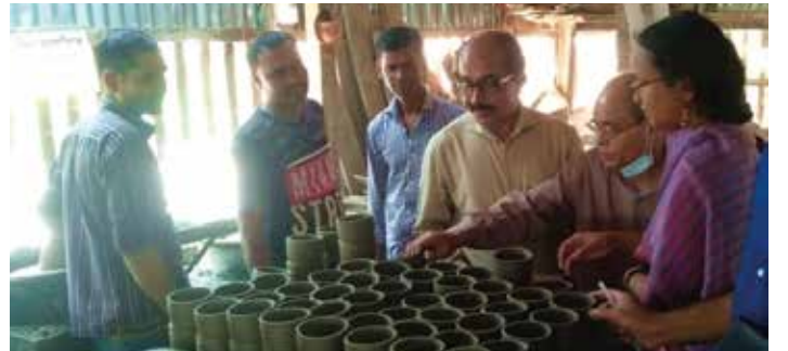
পটুয়াখালীর বাউফল মৃৎশিল্প ক্লাস্টার পরিদর্শন এবং উদ্যোক্তাদের সাথে মতবিনিময়ে অতিথিবৃন্দ