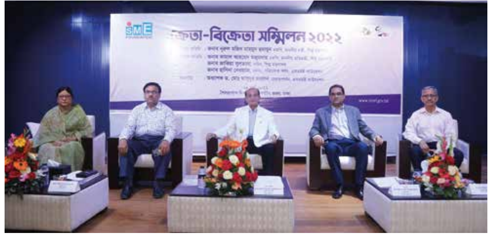
ক্রেতা-বিক্রেতা সম্মিলনের উদ্বোধনী অনুষ্ঠানে শিল্প প্রতিমন্ত্রী কামাল আহমেদ মজুমদার এমপি, ফাউন্ডেশনের চেয়ারপার্সন ও অন্যান্য অতিথিবৃন্দ

উল্লেখ্য, দেশে প্রায় ১০ লক্ষ ক্ষুদ্র ও মাঝারি শিল্প এবং প্রায় ৬৮ লক্ষ কুটির শিল্প প্রতিষ্ঠান রয়েছে; যার ৭.২১ শতাংশ নারী-উদ্যোক্তাদের মাধ্যমে পরিচালিত হচ্ছে। নারীর জন্য সহায়ক কর্মপরিবেশ তৈরি ও নানাবিধ প্রণোদনার ফলে দেশে নারী-উদ্যোক্তার সংখ্যা প্রতি বছর উল্লেখযোগ্য পরিমাণে বৃদ্ধি পাচ্ছে। পণ্যের বাজার সংযোগ বা বাজারজাতকরণ নারী-উদ্যোক্তাদের জন্য অন্যতম প্রধান একটি বাধা। ব্যবসা করার ক্ষেত্রে ৩৭ শতাংশ নারী-উদ্যোক্তা পুঁজি সংকটের কথা উল্লেখ