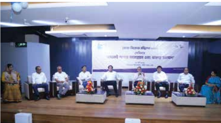
‘এসএমই পণ্যের মানোন্নয়ন বাজার সংযোগ’ সেমিনারে অতিথিবৃন্দ

এসএমই ফাউন্ডেশনের উদ্যোগে আয়োজিত গত পাঁচটি ক্রেতা-বিক্রেতা সম্মিলনে প্রায় ২০০জন নারী-উদ্যোক্তা পণ্য প্রদর্শন করেন এবং প্রায় ১৬০জন নারী-উদ্যোক্তা নিয়মিত দেশের স্বনামধন্য বিভিন্ন ব্যবসা প্রতিষ্ঠানে পণ্য সরবরাহ করছেন।