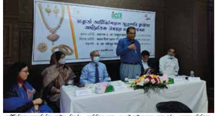
আর্টিফিশিয়াল জুয়েলারি শিল্প ক্লাস্টার পরিদর্শন ও মতবিনিময় সভায় এসএমই ফাউন্ডেশনের চেয়ারপার্সন ও অন্যান্য অতিথিবৃন্দ