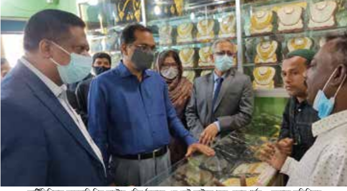
আর্টিফিশিয়াল জুয়েলারি শিল্প ক্লাস্টার পরিদর্শনকালে এসএমই ফাউন্ডেশনের চেয়ারপার্সন ও অন্যান্য অতিথিবৃন্দ